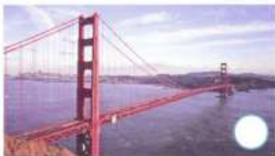
Golden Gate Bridge