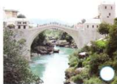
Pont de Mostar