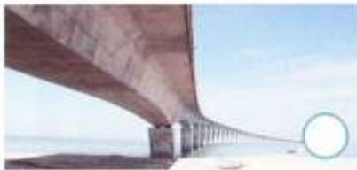
Pont de l'île de Ré