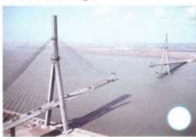
Pont de Normandie