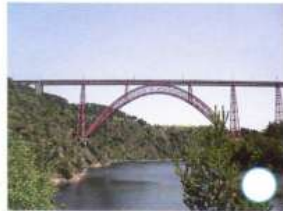
Viaduc de Garabit