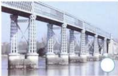
Pont de Cubzac