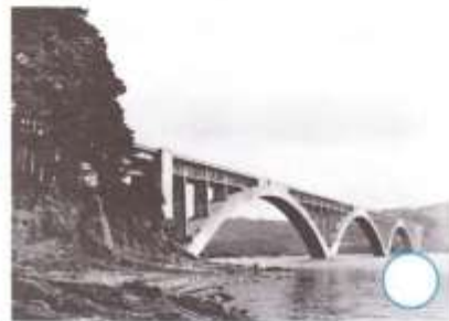
Pont Albert-Loupe à Plougastel